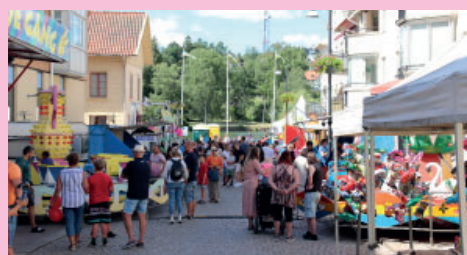
Folkfest på stan.