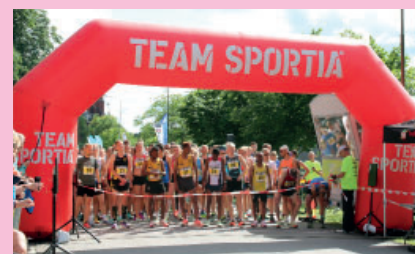
Kraftprovet tillbaka i full skala.